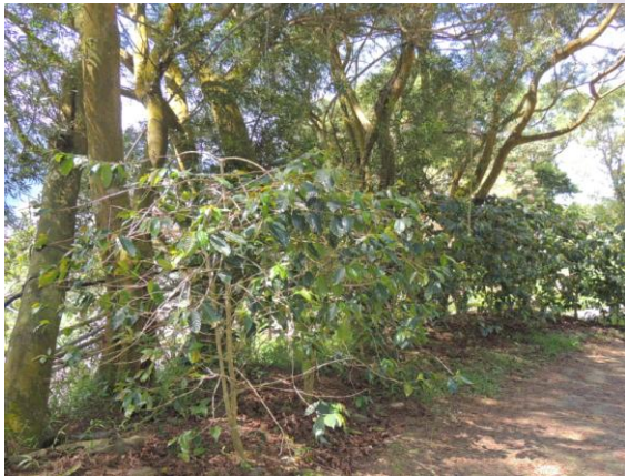
相思樹底下的咖啡樹

泰武咖啡不僅可以品嚐，也很值得觀賞喔！每年三月及九月的開花季節，泰武山上就充滿了咖啡花香，果實從綠色轉紅色，讓人不得不停下腳步慢慢欣賞呢！