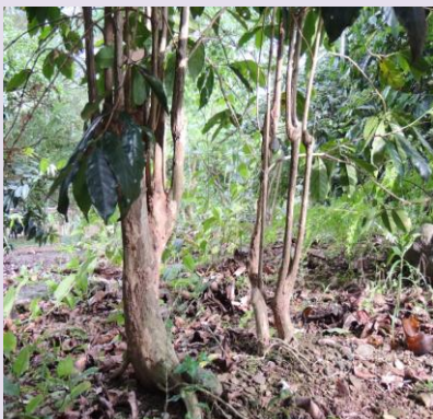
日治時期留下的老咖啡樹