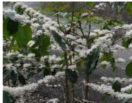
成串的雪白咖啡花盛開